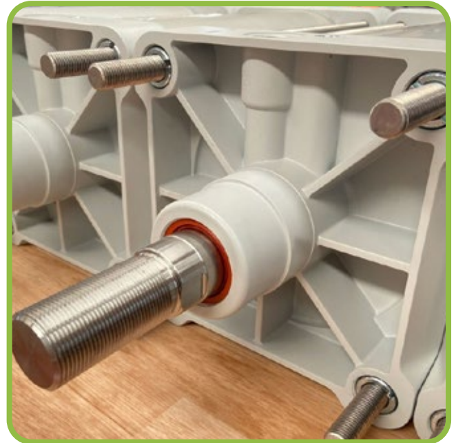
Cilindri speciali per valvole Special cylinders for valves Spezialzylinder für Ventile