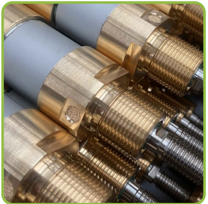
Cilindri speciali in ottone Special brass cylinders Spezial Pneumatikzylinder aus Messing