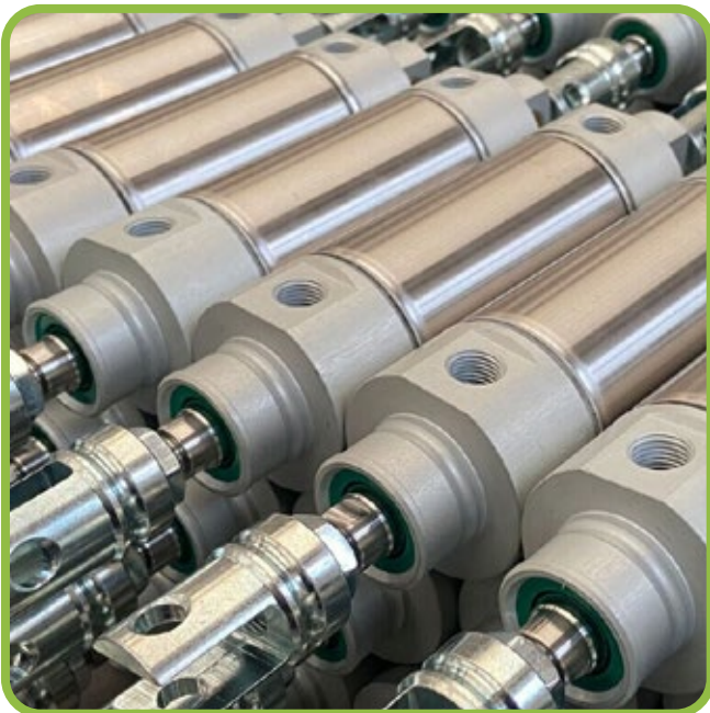
Cilindri speciali per settore Agriculture Special cylinders for Agriculture Spezialzylinder für die Landwirtschaft