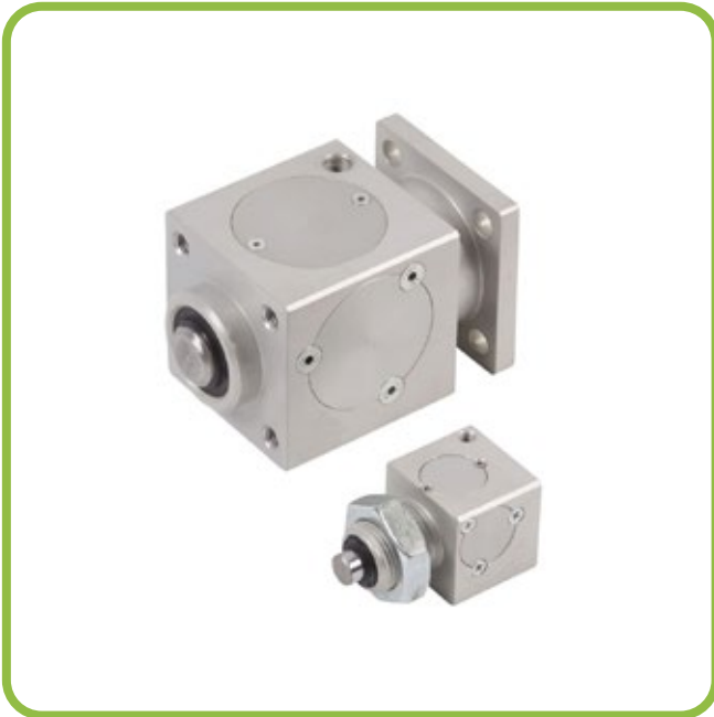
[NEWS] Nuova serie di bloccasteli statici [NEWS] New series of static rod locks [NEWS] Statisch stagenschloss für Zylinder

SEGUICI SU LINKEDIN PER RIMANERE AGGIORNATO FOLLOW US ON LINKEDIN FOR OUR LATEST NEWS FOLGEN SIE UNS AUF LINKEDIN UM ALLE NEUIGKEITEN